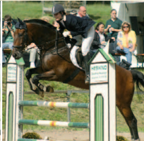
Das Springreiten erfordert schon eine gewisse Erfahrung

Und richtig: Für Pferdeliebhaber und Naturfans ist Reiten eine der schönsten Sportarten überhaupt. Am Anfang braucht es zunächst ein wenig Ausdauer, denn nicht nur der eigene Körper, sondern auch der mitunter eigensinnige vierbeinige Partner benötigt viel Geduld, gezieltes Training – und jede Menge Streicheleinheiten.