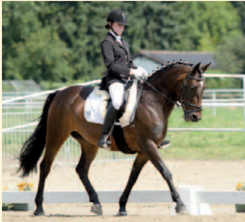
Einheit zwischen Mensch und Pferd beim Dressurreiten

... liegt auf dem Rücken der Pferde. So lautet ein berühmtes Sprichwort in Reiterkreisen